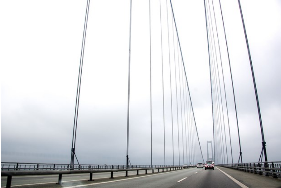
Gennemsnitligt kører der næsten 36.000 biler over Sprogø hver dag.

Der kører cirka 110 passagertog over Storebælt hver dag samt 30 godstog. Og i år er der hver dag til og med august - i gennemsnit - kørt 35.859 biler over broerne og Sprogø.