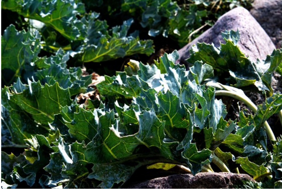
95 plantearter er forsvundet fra Sprogø siden 1978. 40 nye er kommet til.